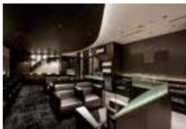
QUALIA LOUNGE 3階 保安検査前