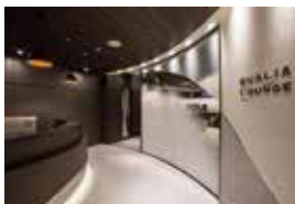
QUALIA LOUNGE 3階 保安検査前レセプション